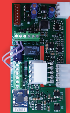
elektronická zásuvná karta kompatibilná so všetkými riadiacimi jednotkami Entrematic

(1) Nainštalujte elektronickú kartu (MOBCRE) do zásuvky pre príslušenstvo na riadiacej jednotke Entrematic alebo na držiak karty základne CONT1.