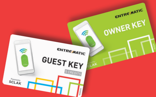
vlastnícke a hosťovské prístupové práva

(3) Postupujte podľa pokynov v aplikácii: aktivujte kartu a určte správcu / vlastníka inštalácie. Ak je potrebných viac prístupových údajov, sú k dispozícii karty Entrematic s ďalšími aktivačnými kódmi